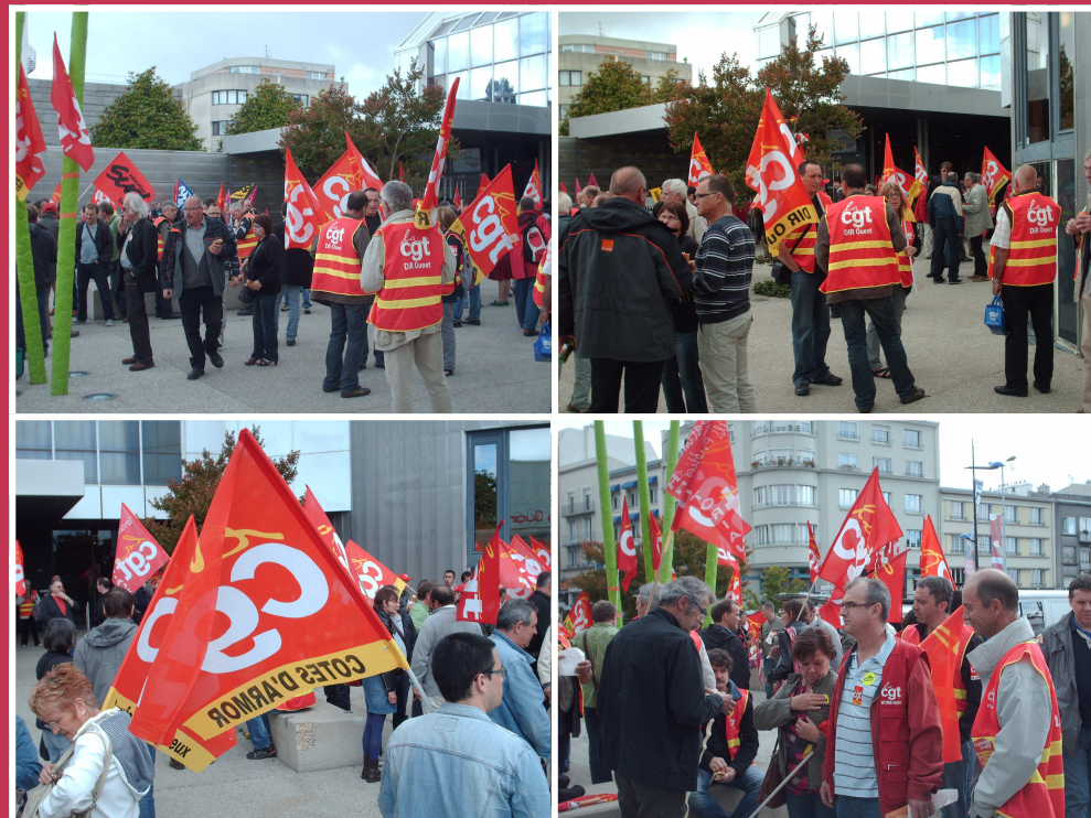
Mardi 10 juillet 2012, à l'occasion de la journée de l'industrie, rassemblement devant le Quartz, à l'initiative de la CGT, de la FSU et de Solidaires, pour la redynamisation du tissu industriel et l'amélioration du dialogue social.